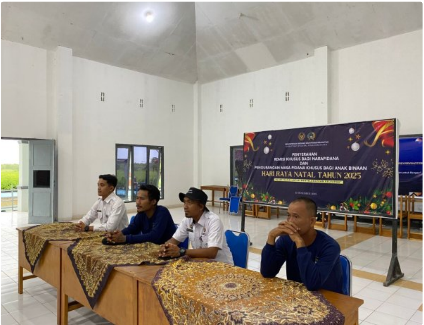
Nusakambangan (24/12) – Dalam rangka menyambut Hari Raya Natal, Warga