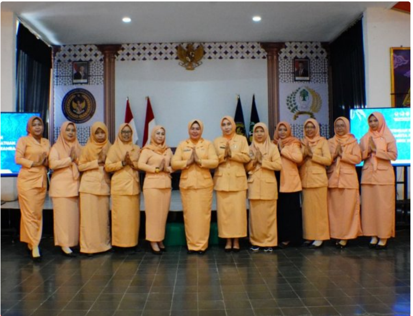
Pertemuan Rutin DWP Lapas Besi, Wadah Penguatan Peran dan Kebersamaan

Cilacap – Dharma Wanita Persatuan (DWP) Lapas Kelas IIA Besi Nusakambangan menggelar pertemuan rutin bulanan pada Sabtu, 6 Desember 2025, bertempat di Aula Lapas Besi.