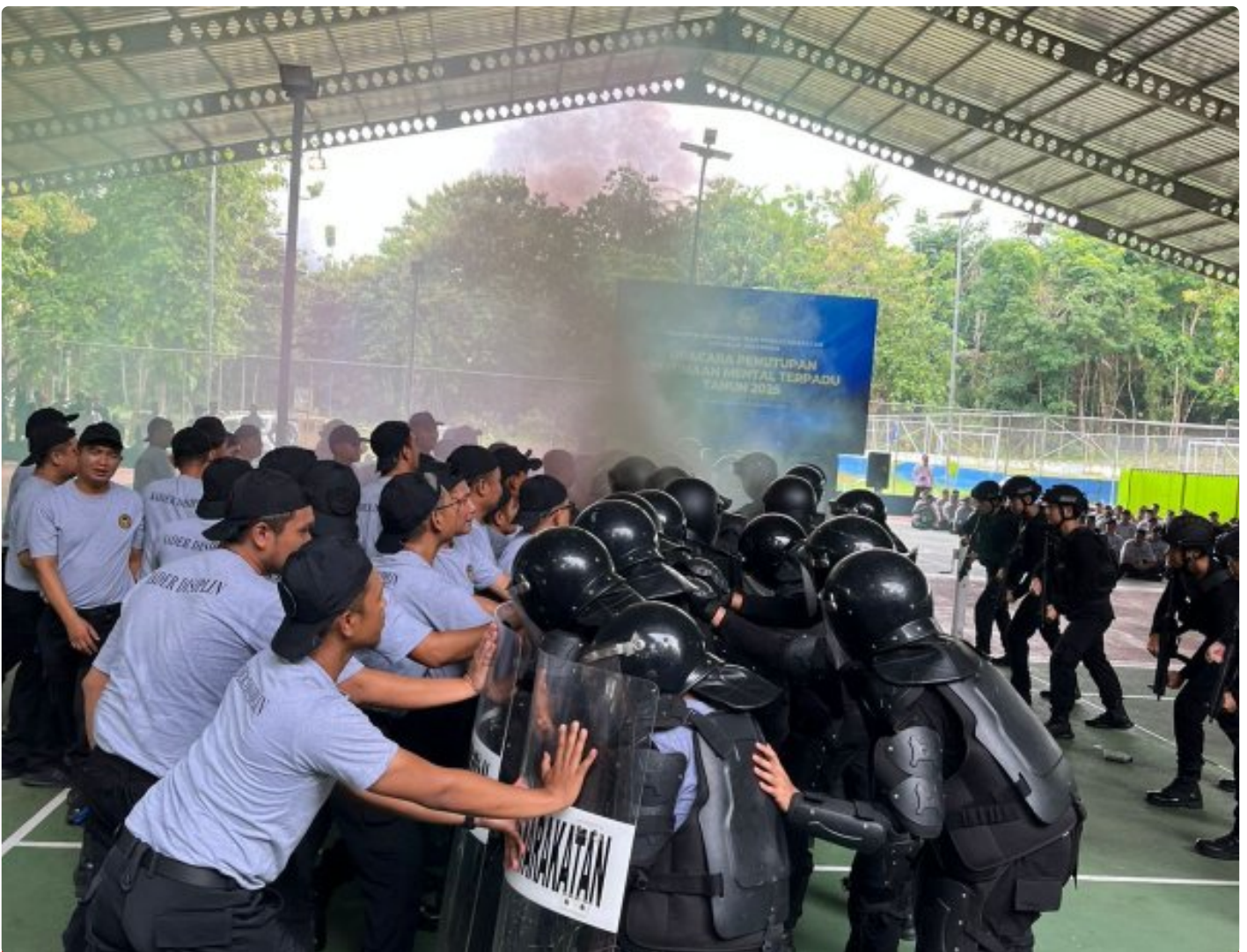
Penutupan Pembinaan Mental Terpadu 2025, Kalapas Kembang Kuning hadir dan berikan Apresiasi

Cilacap – Kegiatan Pembinaan Mental Terpadu Tahun 2025 resmi ditutup, kegiatan bertempat di Lapangan Tenis Nusakambangan. Program yang telah berlangsung selama satu bulan penuh ini diikuti oleh pegawai Pemasyarakatan dan Imigrasi dari berbagai Unit Pelaksana Teknis (UPT) di seluruh Indonesia,