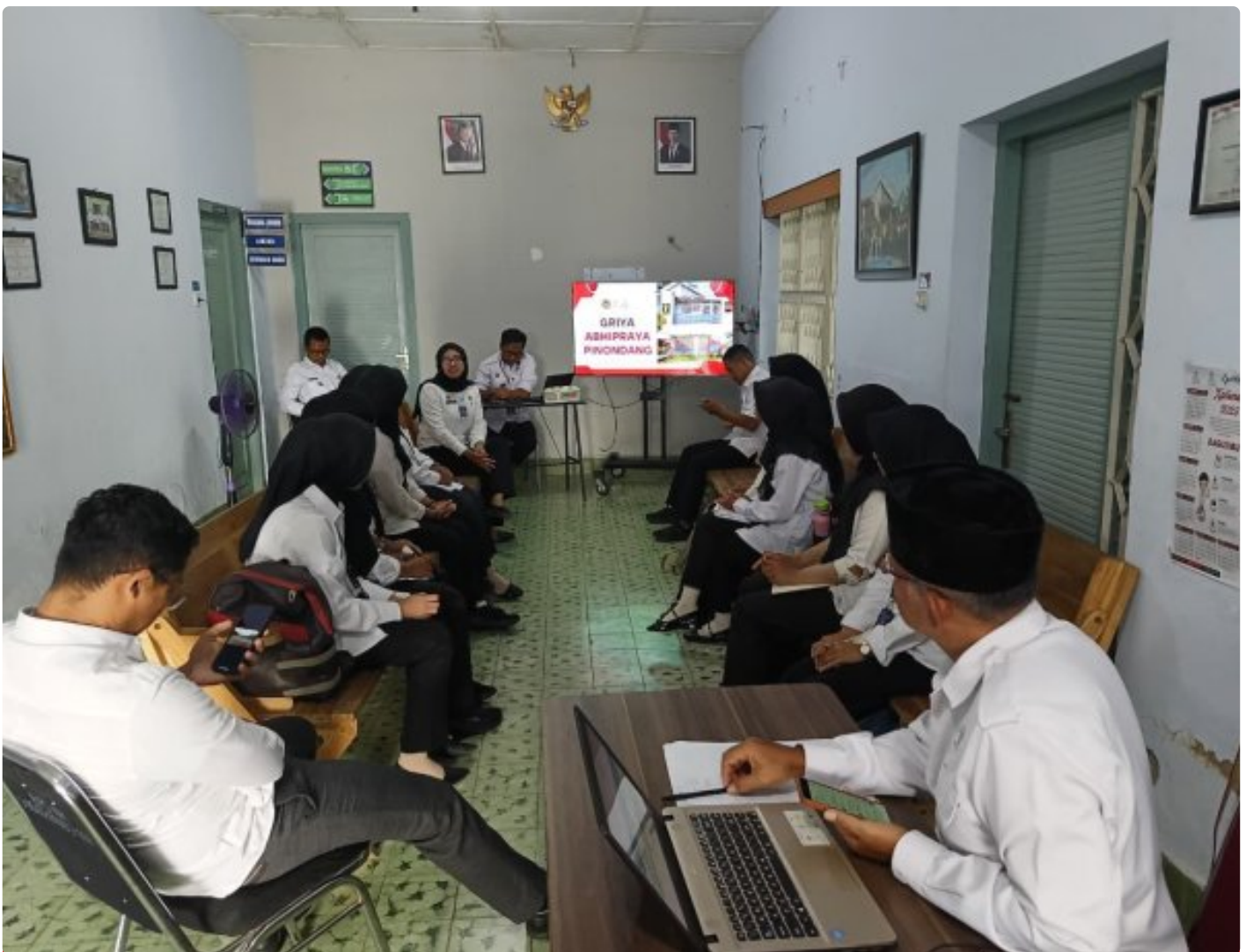
GA Pinondang Bapas Nusakambangan Lakukan Pengarahan Kepada Peserta Magang Terkait Kegiatan Griya Abhipraya

Nusakambangan, 03 Desember 2025 – Griya Abhipraya (GA) Pinondang Bapas Kelas II Nusakambangan kembali menerima peserta magang yang akan mulai mengikuti rangkaian kegiatan pembimbingan setelah sebelumnya melaksanakan