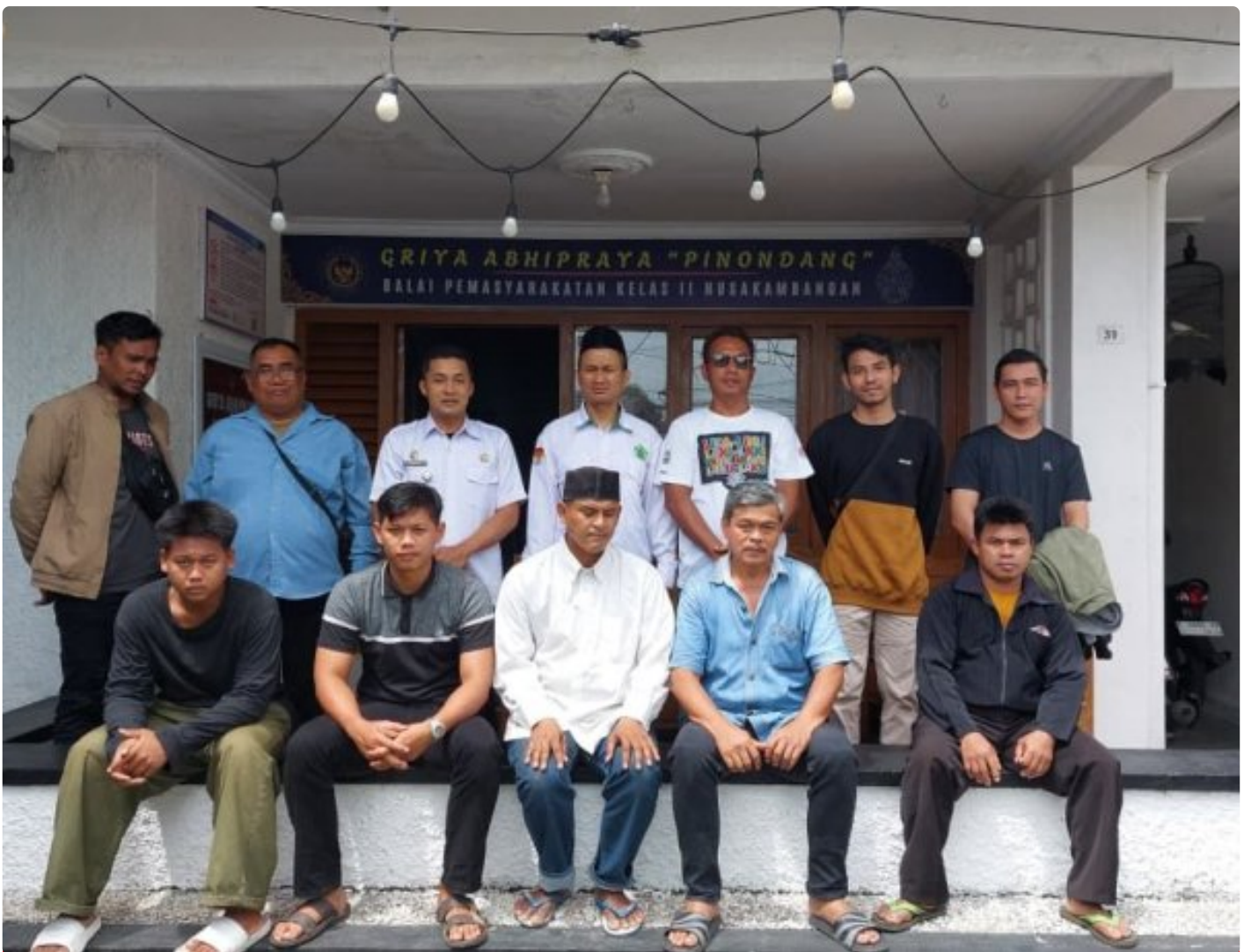
Bimbingan Kepribadian dengan Kemenag Kab. Cilacap untuk Klien Pemasyarakatan Bapas Nusakambangan

Cilacap, 08 Desember 2025 – Balai Pemasyarakatan (Bapas) Kelas II Nusakambangan melalui Griya Abhipraya Pinondang kembali melaksanakan kegiatan Bimbingan Kepribadian Keagamaan bagi klien pemasyarakatan. Kegiatan ini berlangsung pada hari ini dan diisi oleh Ustad Munir dari Kantor