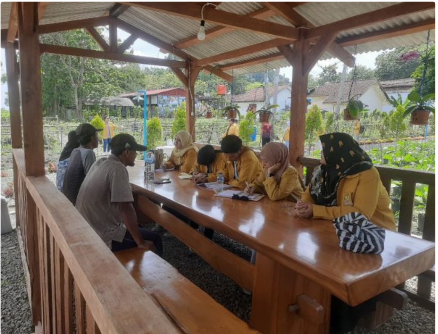
Mahasiswa Program Magister Unsoed Laksanakan Kunjungan Akademik ke Lahan Pertanian dan Peternakan Lapas Kelas IIA Kembang Kuning

Cilacap - Lapas Kelas IIA Kembang Kuning menerima kunjungan akademik dari