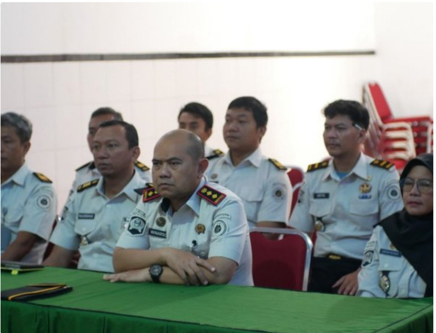
Lapas Kembang Kuning Ikuti Pengarahan Kesiapan Layanan Kunjungan Hari Raya Idul Fitri 1447 H

Cilacap – Dalam rangka mempersiapkan pelaksanaan layanan kunjungan Hari Raya Idul Fitri 1447 H, Lembaga Pemasarakatan (Lapas) Kelas IIA Kembang Kuning Nusakambangan mengikuti kegiatan pengarahan terkait kesiapan layanan kunjungan yang diselenggarakan oleh Direktorat Jenderal