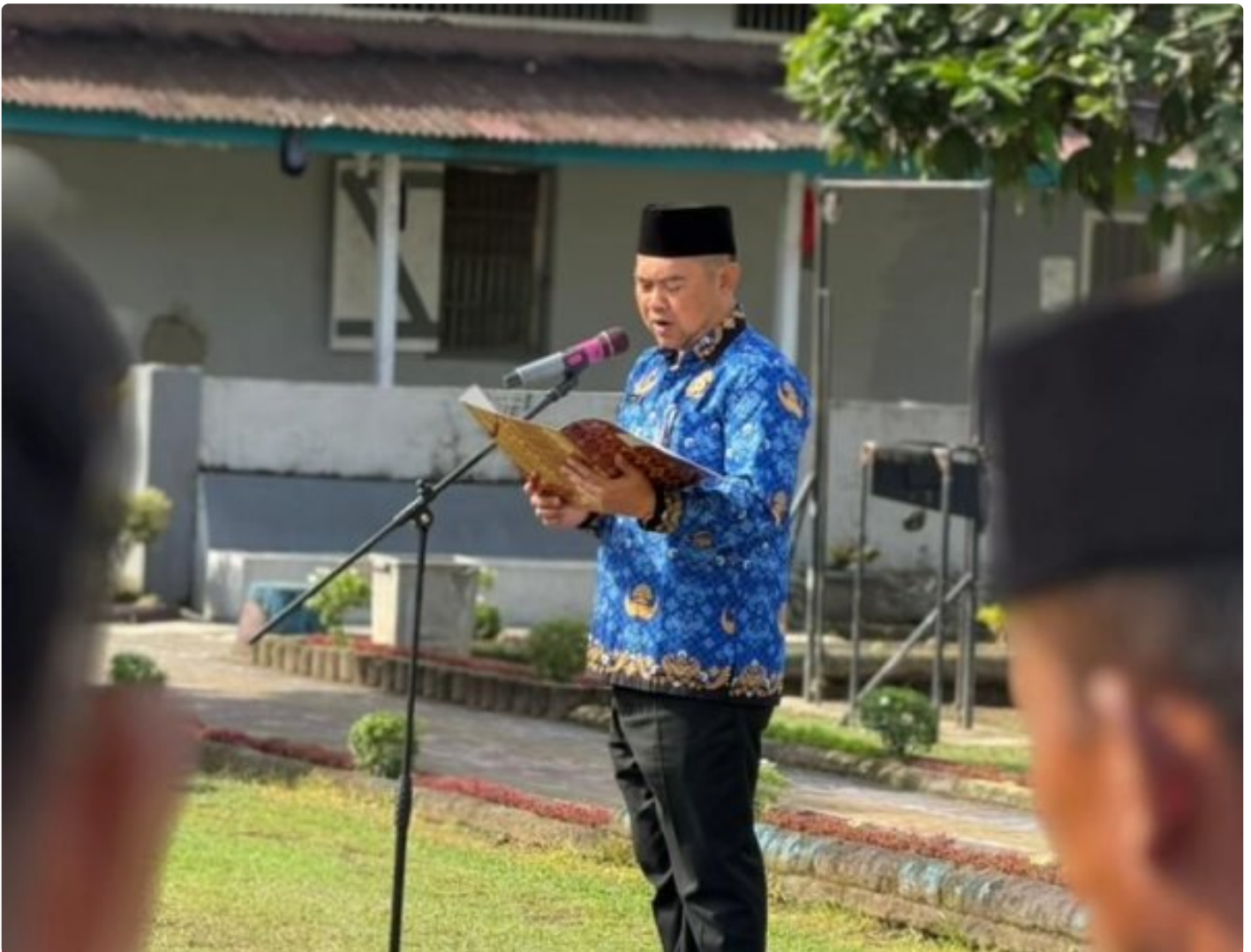
Lapas Kembang Kuning Gelar Upacara Peringatan Hari Bela Negara ke-77 Tahun 2025

Cilacap – Lembaga Pemasyarakatan (Lapas) Kelas IIA Kembang Kuning melaksanakan Upacara Peringatan Hari Bela Negara ke-77 Tahun 2025 dengan khidmat di lapangan upacara Lapas Kembang Kuning, Jumat (19/12/2025).