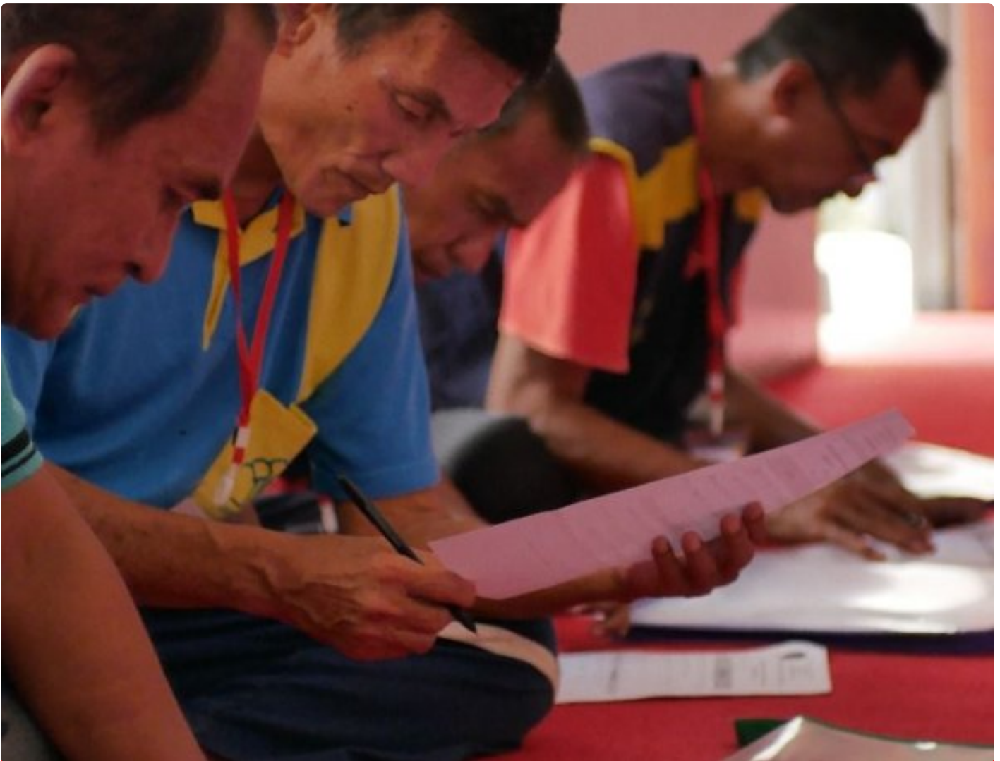
Lapas Kelas IIA Kembang Kuning Laksanakan Rehabilitasi Sosial Bersama BNN Kabupaten Cilacap

Cilacap - Lapas Kelas IIA Kembang Kuning bekerja sama dengan Badan Narkotika Nasional Kabupaten (BNNK) Cilacap melaksanakan kegiatan rehabilitasi sosial bagi Warga Binaan Pemasyarakatan (WBP), sebagai bagian dari upaya pembinaan dan pemulihan bagi WBP penyalahguna narkoba, Senin