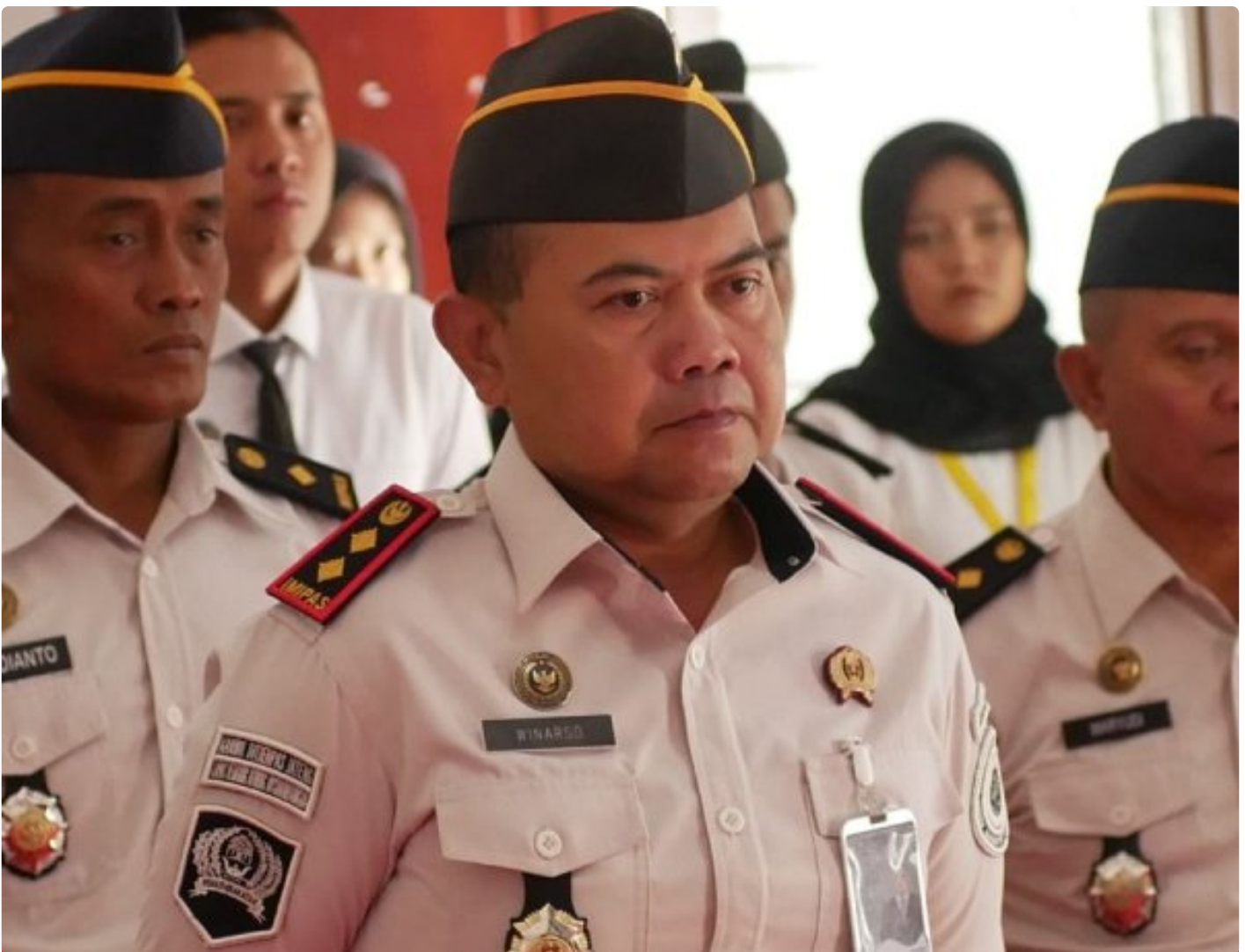
Lapas Kelas IIA Kembang Kuning Ikuti Apel Bersama Awal Tahun 2026 Kemenko Kumham Imipas

Cilacap – Lembaga Pemasyarakatan (Lapas) Kelas IIA Kembang Kuning mengikuti Apel Bersama Awal Tahun 2026 yang diselenggarakan oleh Kementerian Koordinator Bidang Hukum, HAM, Imigrasi, dan Pemasyarakatan (Kemenko Kumham Imipas), Senin (12/01/2026).