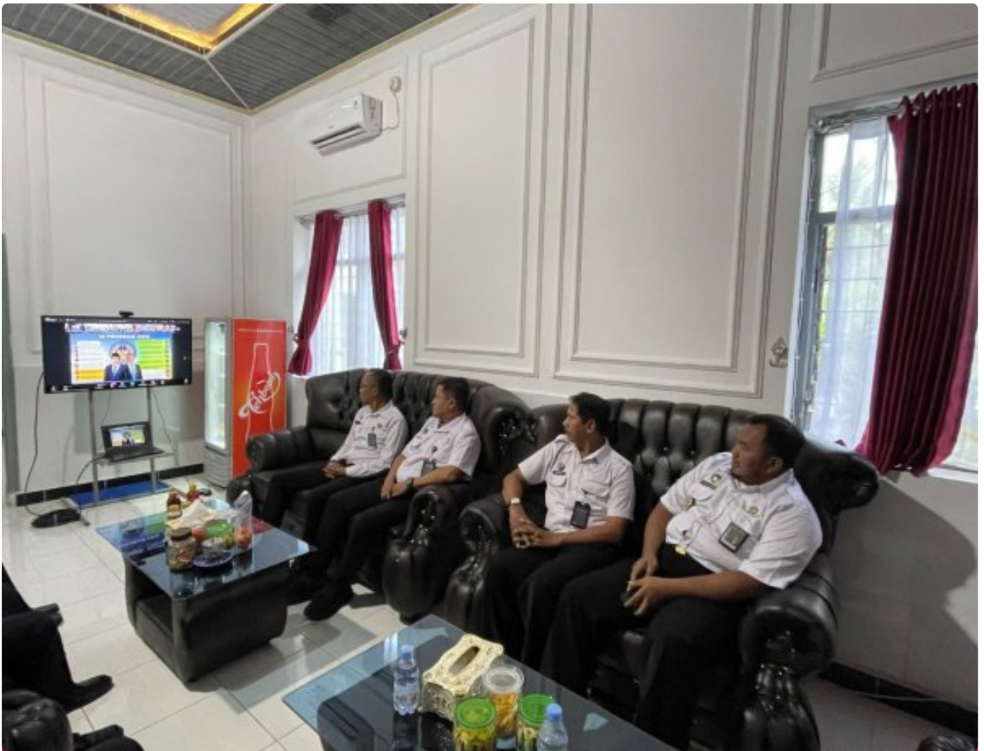
Lapas Besi Nusakambangan Mantapkan Langkah Hadapi KUHP dan KUHP Baru

Cilacap – Lembaga Pemasyarakatan (Lapas) Kelas IIA Besi Nusakambangan mengikuti kegiatan. Pengarahan Direktur Jenderal Pemasyarakatan terkait Pemberlakuan Kitab Undang-Undang Hukum Pidana (KUHP) Tahun 2023 dan Kitab Undang-Undang Hukum Acara Pidana (KUHP) Tahun 2025 pada Bidang Pelayanan Tahanan yang dilaksanakan secara virtual pada Selasa, 6 Januari 2026.