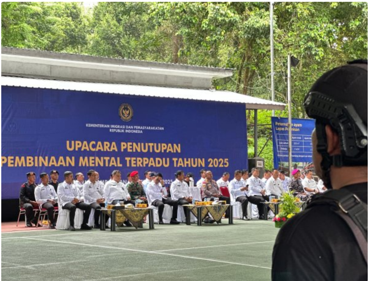
Kalapas Magelang hadiri Penutupan Pembinaan Mental Terpadu Tahun 2025

Cilacap - Kepala Lembaga Pemasyarakatan Kelas IIA Magelang menghadiri kegiatan penutupan Pembinaan Mental Terpadu Tahun 2025 yang diselenggarakan oleh Kementerian Imigrasi dan Pemasyarakatan Rabu 03/12/2025).