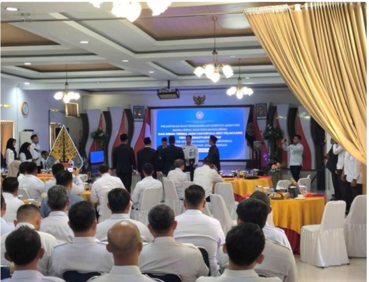
Kalapas Magelang hadir Pelantikan Tiga Pejabat Manajerial dan Non Manajerial di Nusa Kambangan

Cilacap - Kepala Lembaga Pemasyarakatan (Kalapas) Kelas IIA Magelang menghadiri pelantikan dan pengambilan sumpah jabatan tiga pejabat manajerial dan non manajerial yang dilaksanakan di Nusakambangan, Sabtu (20/12/2025).