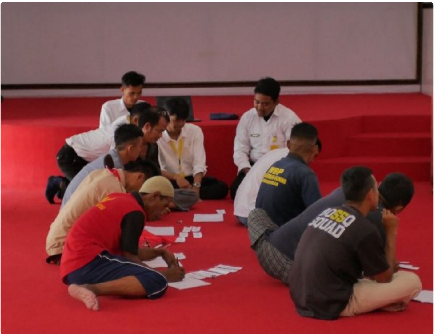
Belajar Membaca dan Menulis, Peserta Magang Lapas Kembang Kuning Dampingi WBP

Cilacap - Peserta magang di Lapas Kelas IIA Kembang Kuning melaksanakan kegiatan pendampingan belajar membaca dan menulis bagi Warga Binaan Pemasyarakatan (WBP), sebagai bagian dari program literasi yang bertujuan meningkatkan kemampuan dasar pendidikan WBP, Selasa (16/12/2025).